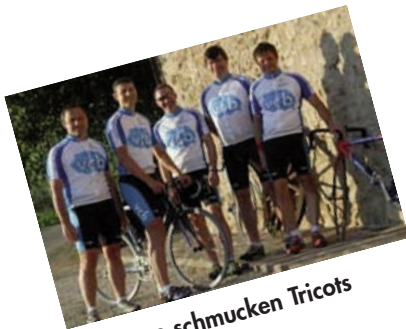
Unsere schmucken Tricots