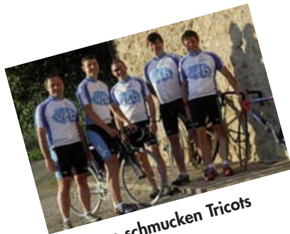
Unsere schmucken Tricots